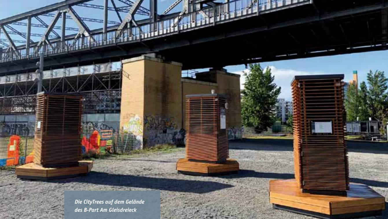
Die CityTrees auf dem Gelände des B-Part Am Gleisdreieck